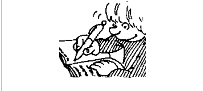
Le garçon écrit sur le cahier.

Colle les étiquettes sous les bons dessins et recopie le mot en capitales