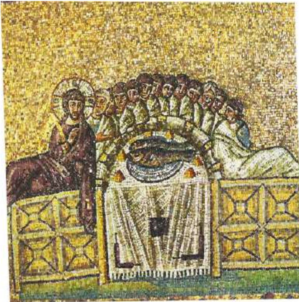
Doc 3 Jésus et ses disciples, les fondateurs du Christianisme