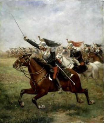
Charge des cuirassiers le 6 août 1870

Quelle décision la France a-t-elle prise face aux nombreuses défaites?