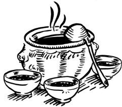
de la soupe