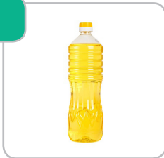
Huile de tournesol