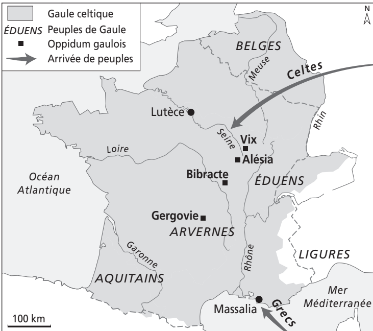
Doc. 1 Les migrations de population : l'arrivée des Celtes et des Grecs à partir du VII e siècle av. J.-C.

1. Quels sont les deux peuples qui migrent en Gaule d'après cette carte ?