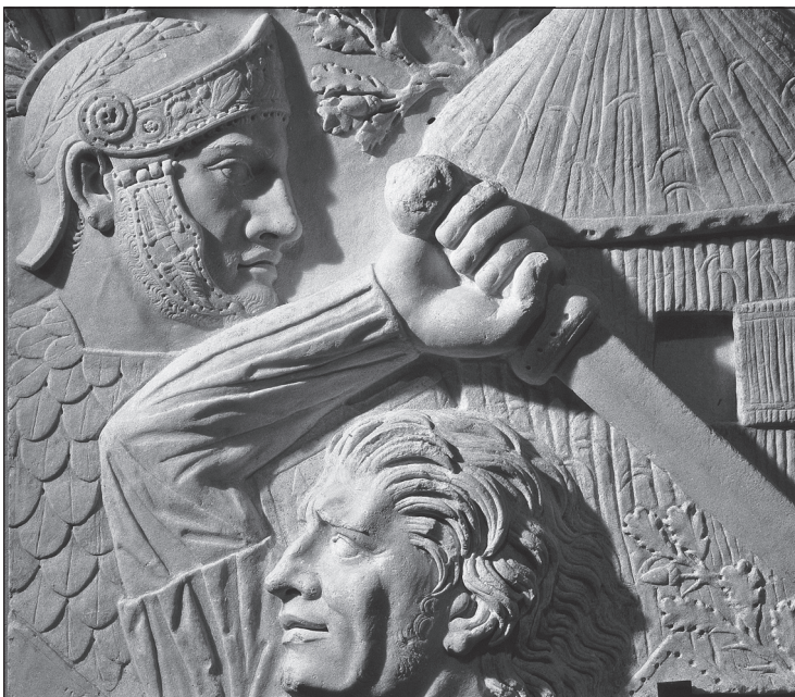
Doc. 2 Un guerrier gaulois, bas-relief du II e siècle.