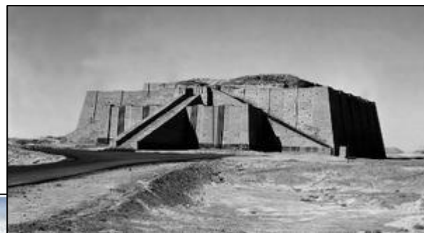
Temple du dieu-lune Nanna à Ur

Les Mésopotamiens croient en plusieurs dieux, ils sont polythéistes .