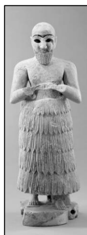
Statuette d'orant aux mains jointes vêtu de la jupe de kaunakès Vers 2500 avant J.-C. Mari, temple d'Ishtar Albâtre

Les Mésopotamiens sont surtout des agriculteurs. Ils portent le kaunakès , une tunique en peau de mouton.