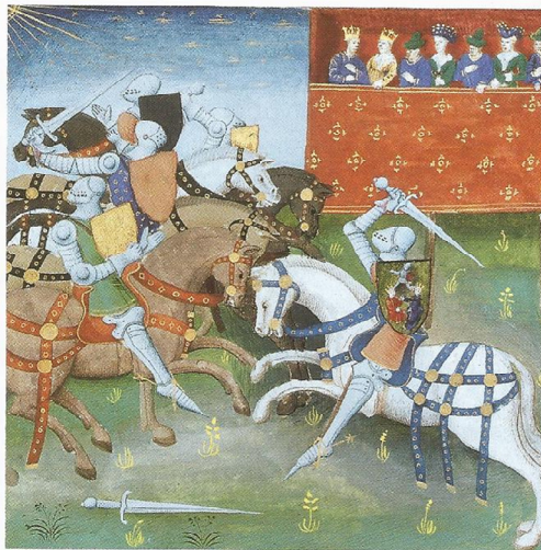
Scène de tournoi (manuscrit du XV e siècle).

1. barrières – 2. frapper – 3. charger – 4. chevaux de combat