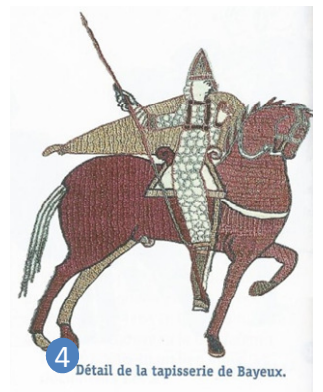
4 Détail de la tapisserie de Bayeux.

Dans le texte, souligne les phrases qui montrent que les chevaliers se préparent à la guerre.