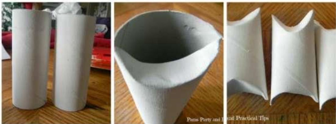
Rabattre les bords du haut du rouleau