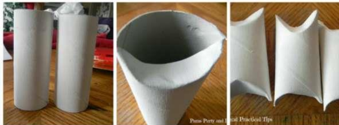
Rabattre les bords du haut du rouleau