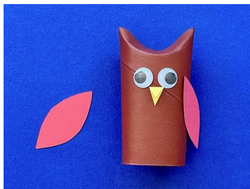
Réaliser les ailes