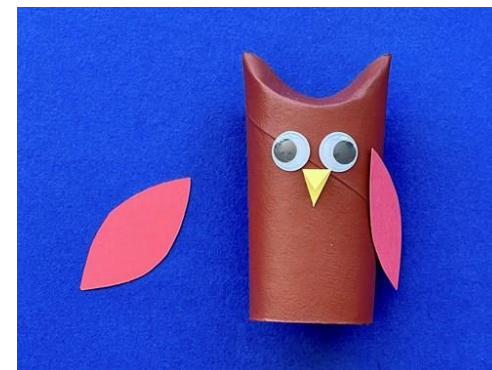
Réaliser les ailes