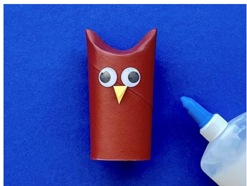
Réaliser les yeux et le bec