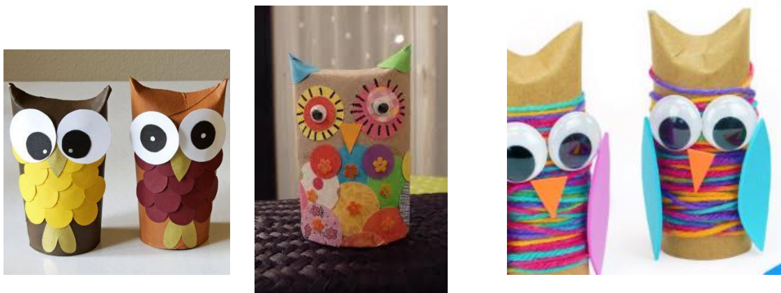
Décorer le hibou