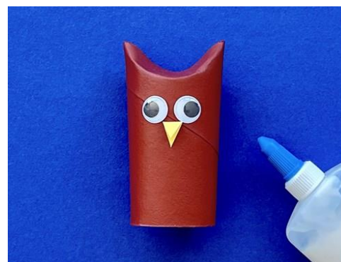
Réaliser les yeux et le bec