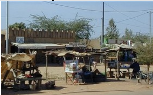
Un quartier en périphérie