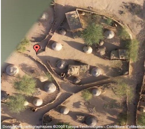
Données cartographiques ©2008 Europa Technologies - Conditions d'utilisation Aperçu de « concessions » vu du ciel.