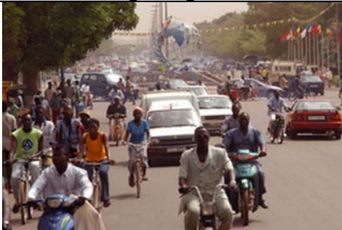
Une grande rue du centre