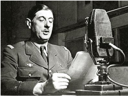
Dès le 18 juin 1940, le Général de Gaulle appelle les français à résister aux allemands. C'est l' appel du 18 juin .