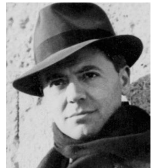
Jean Moulin va organiser la résistance en France. Il sera arrêté et mourra après avoir été torturé.