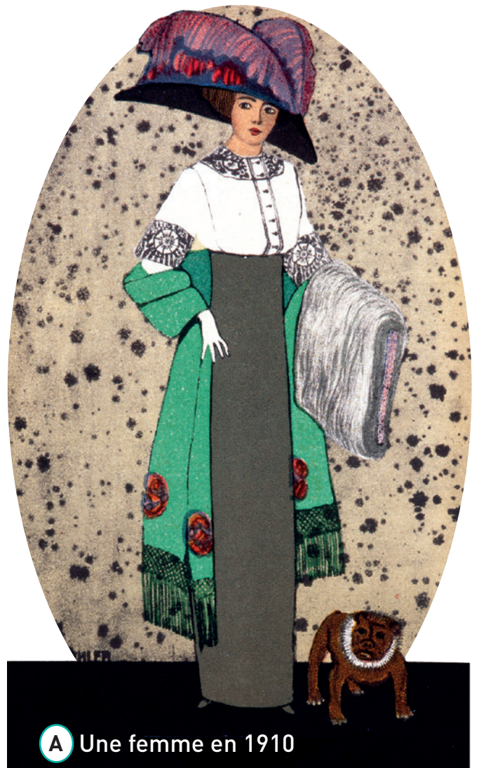
A Une femme en 1910