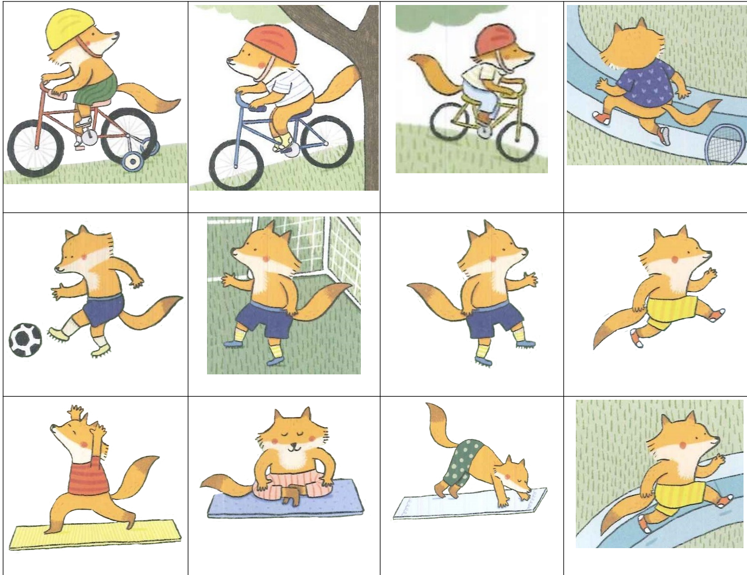
Images à découper par l'adulte.