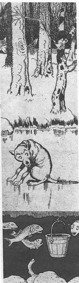
La pêche d'Ysengrin, illustration de Benjamin Rabier, 1909.

L'hiver est particulièrement rude et tous les animaux peinent à trouver à manger. Renart a réussi à voler un panier d'anguilles. Le loup Ysengrin, lui aussi affamé, lui demande comment il se les est procurées. Renart affirme avoir pêché lui-même ces poissons dans un étang voisin et promet à Ysengrin de l'y emmener.