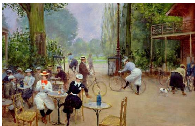
Le chalet du cycle au bois de Boulogne – Jean Béraud – vers 1900

Les ..... dans l'industrie et l'amélioration des ..... permettent un optimisme des classes moyennes. A Paris, les ..... proposent des spectacles ; les ..... se développent : vélo, voile, automobile.