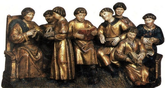
Une classe au 16 e siècle (bois peint à l'or, 16 e siècle, musée de Cluny, Paris).