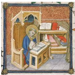
Les objets et œuvres d'art