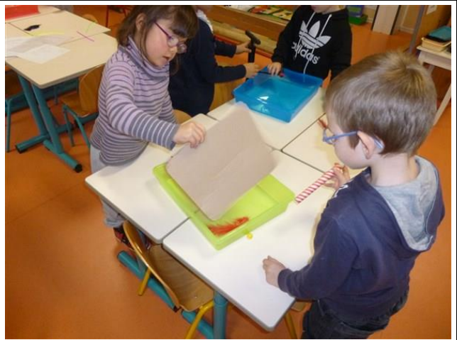
un carton !