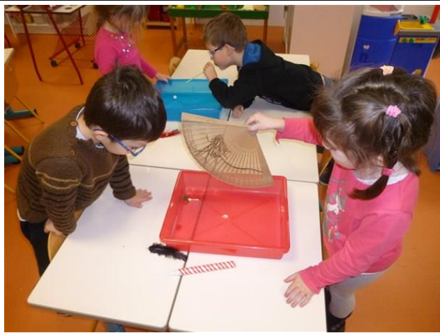
un éventail !