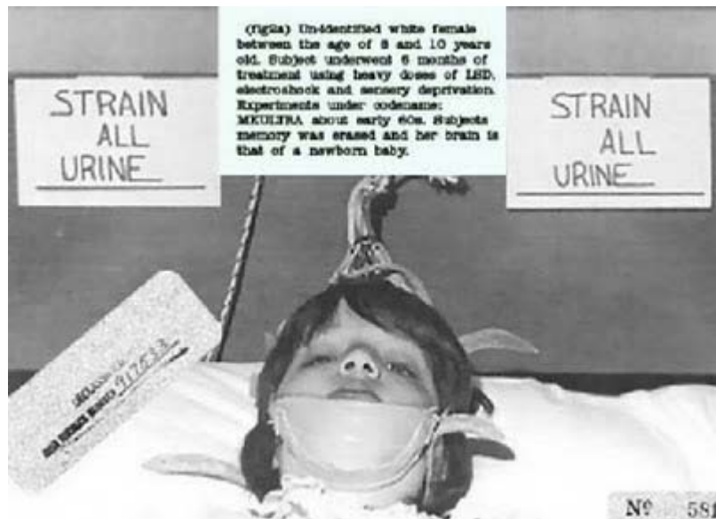
Photo rendue accessible d'un jeune sujet MK-ULTRA en 1961

(Inscription au-dessus de la photo : enfant féminin de 8 à 10 ans qui suite à une période de 6 mois de LSD, torture, électrochocs et privation sensorielle a le cerveau d'un nouveau né. De chaque côté de la fillette figure une affiche avec : "Filtrer les urines")