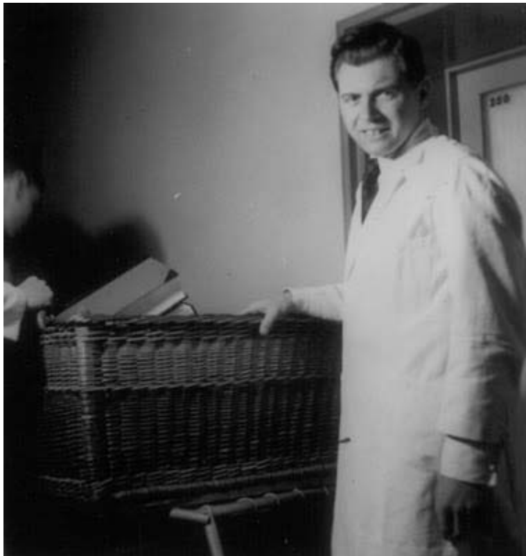
Joseph Mengele, 1935

Une des premières études méthodiques sur le contrôle mental basé sur les traumatismes fut menée par Joseph Mengele, un médecin travaillant dans les camps de concentration nazis. Il a d'abord atteint la notoriété comme médecin SS supervisant la sélection des nouveaux prisonniers, déterminant qui devait être tué et qui devait devenir un travailleur forcé. Cependant, il est surtout connu pour avoir fait des expériences macabres sur les détenus, dont des enfants, par lesquels Mengele était appelé « l'Ange de la Mort »