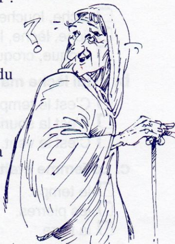
D'après Hanzel et Gretel.

Hanzel et Gretel eurent si peur qu'ils laissèrent tomber ce qu'ils tenaient.