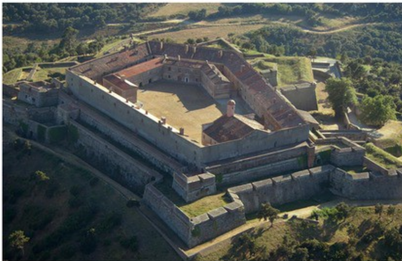
Le fort de Bellegarde (Perthus) - Frontière France - Espagne