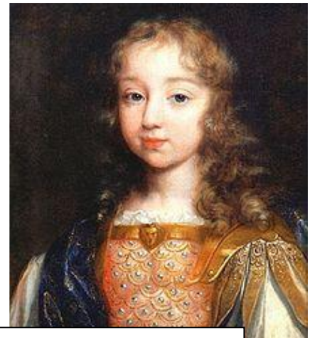
Louis XIV à 5 ans

En 1648, les grands seigneurs du royaume se révoltent contre Mazarin et la famille royale, si bien que la reine et ses deux enfants, Louis Dieudonné et son petit frère Philippe, doivent s'enfuir. Cette révolte s'appelle la Fronde . En 1653, Mazarin réussit à y mettre un terme. Cette période de l'enfance de Louis XIV le marquera profondément et influencera son règne.