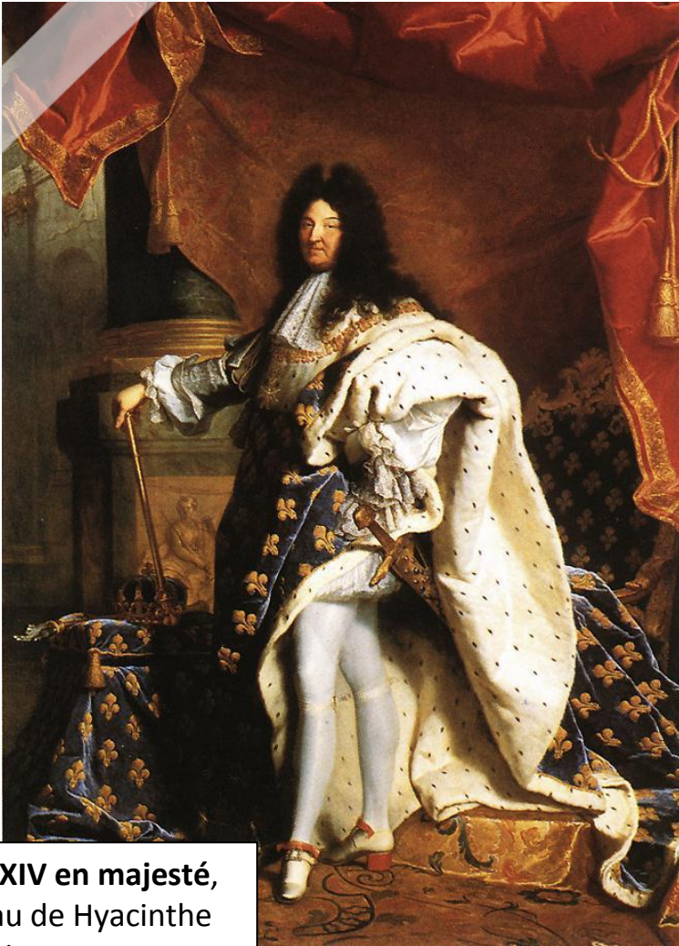
Louis XIV en majesté, tableau de Hyacinthe Rigaud, 1648

1. Observe ce tableau de Louis XIV en majesté et réponds aux questions suivantes :