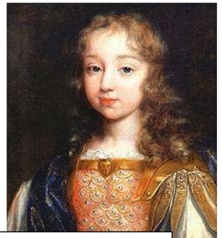
Louis XIV à 5 ans

En 1648, les grands seigneurs du royaume se révoltent contre Mazarin et la famille royale, si bien que la reine et ses deux enfants, Louis Dieudonné et son petit frère Philippe, doivent s'enfuir. Cette révolte s'appelle la Fronde . En 1653, Mazarin réussit à y mettre un terme. Cette période de l'enfance de Louis XIV le marquera profondément et influencera son règne.