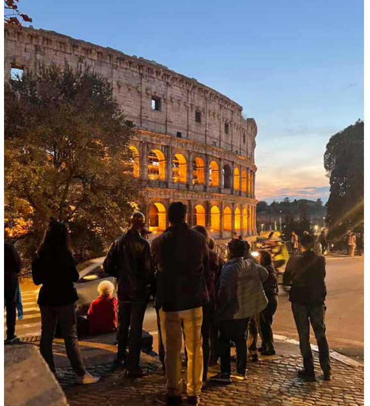
Les membres se rassemblent autour d'un guide touristique au Colisée.