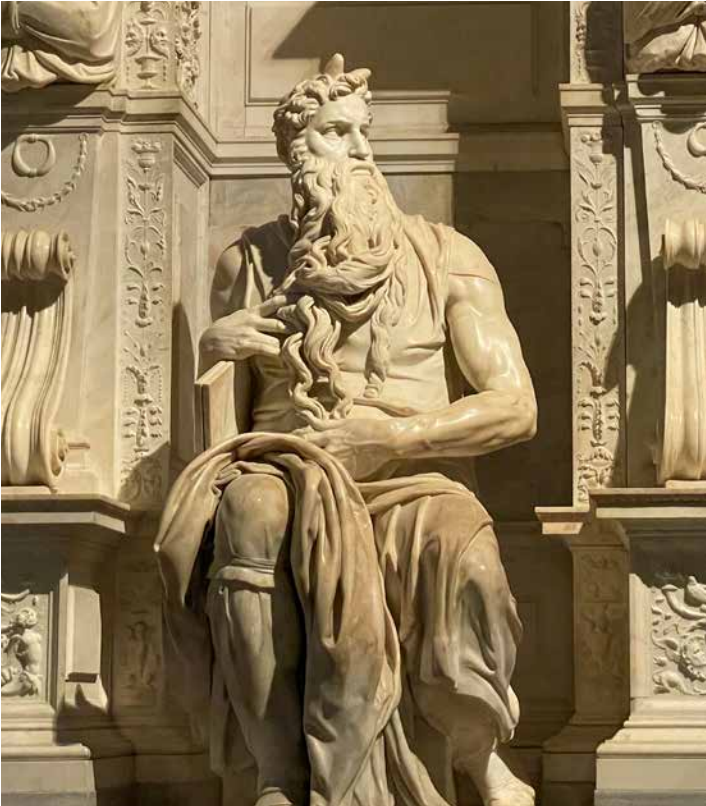
Moïse de Michel-Ange à la Basilique Saint-Pierre-des-Chaînes.