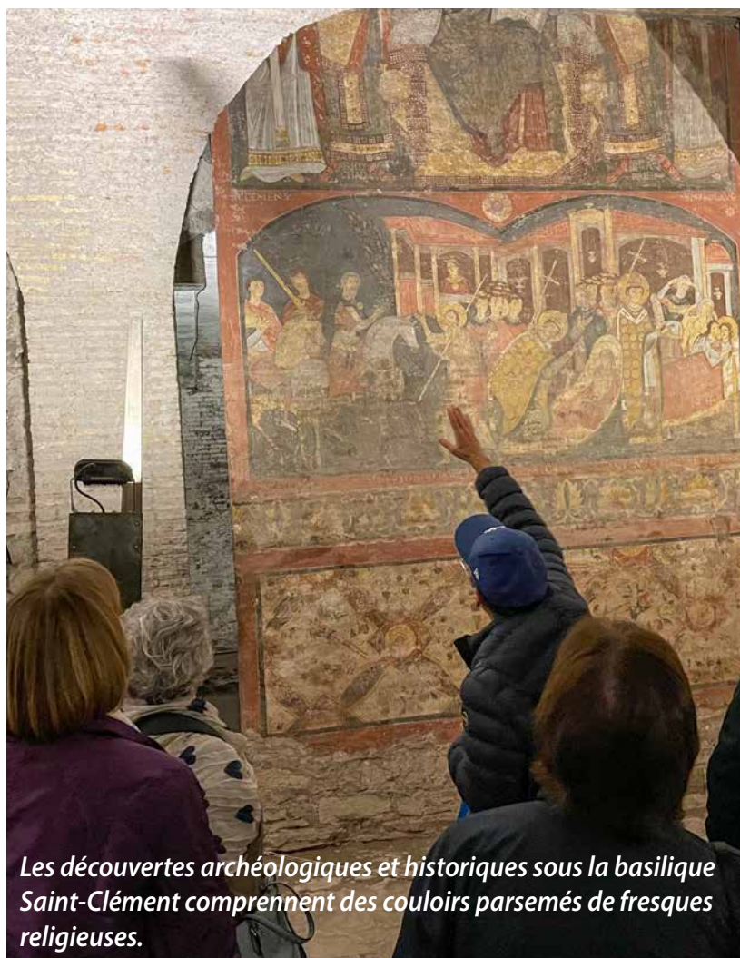
Les découvertes archéologiques et historiques sous la basilique Saint-Clément comprennent des couloirs parsemés de fresques religieuses.