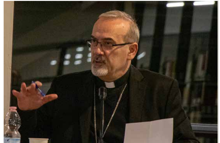
Mgr Pierbattista Pizzaballa, patriarche latin de Jérusalem, parle de « Fratelli Tutti ».

Originaire de Cologno al Serio (Bergame), Italie, le Patriarche a été ordonné prêtre dans l'Ordre des Frères Mineurs (OFM) le 15 septembre 1990. Le mois suivant, il a été envoyé en Terre Sainte et est ensuite entré au service de la Custodie de Terre Sainte. Il a obtenu une licence en théologie biblique au Studium Biblicum Franciscanum à Jérusalem.