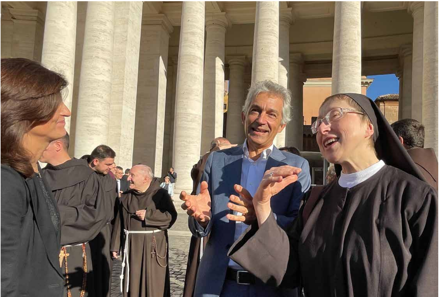
Frères, séculiers et clarisses se sont réunis à la place Saint-Pierre, exprimant leur joie de faire partie de la même famille.