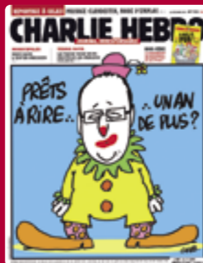
François Hollande, le président de la République, est représenté en clown en Une du 24 décembre 2013.

Ce journal est satirique : il parle de l'actualité en donnant son avis et en se moquant, surtout avec des dessins. Il a le droit de faire cela : la presse est libre dans notre pays. Mais les journalistes de Charlie Hebdo recevaient parfois des menaces de personnes qui détestaient leur travail.