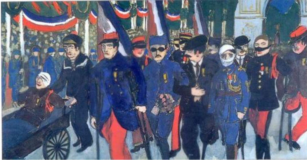
Tableau de Jean Galtier-Boissière peint en 1919.