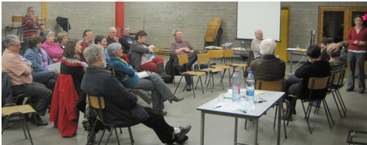
Réunion du 18/03/2013