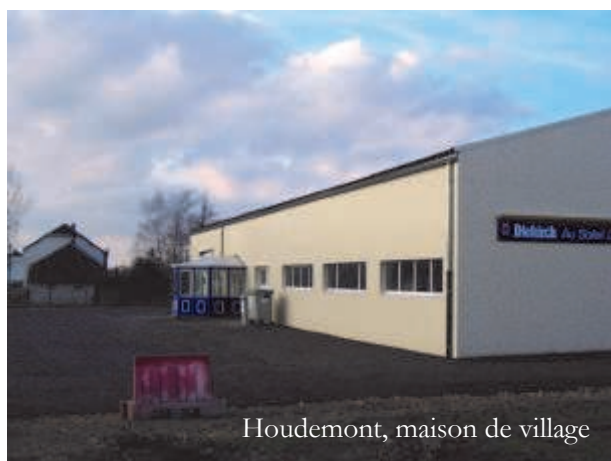
Houdemont, maison de village