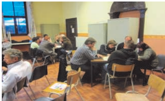
Réunion à Marbehan - 2/05/2012

Une réunion des forces vives, des associations de la commune, pour compléter cette consultation des habitants, s'est tenue en février 2013.