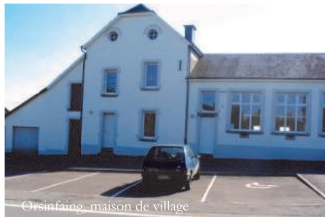
Orsinfaing, maison de village