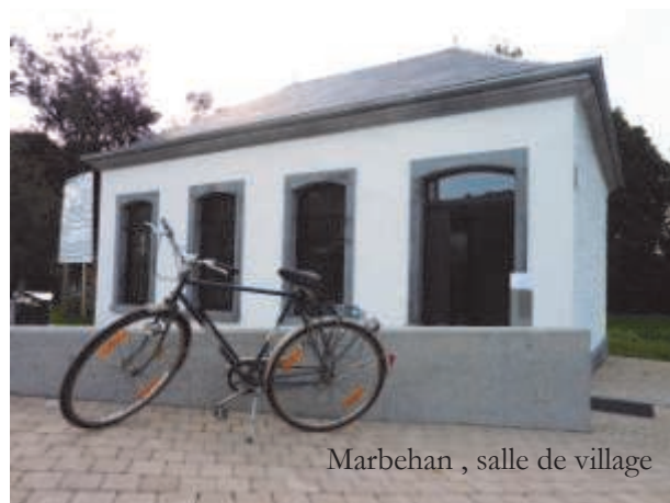
Marbehan, salle de village

« Une opération de Développement rural consiste en un ensemble coordonné d'actions de développement, d'aménagement et de réaménagement entreprises ou conduites en milieu rural par une commune, dans le but de sa revitalisation et de sa restauration, dans le respect de ses caractères propres et de manière à améliorer les conditions de vie de ses habitants au point de vue économique, social et culturel. [...] ».