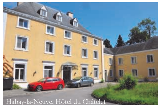
Habay-la-Neuve, Hôtel du Châtelet