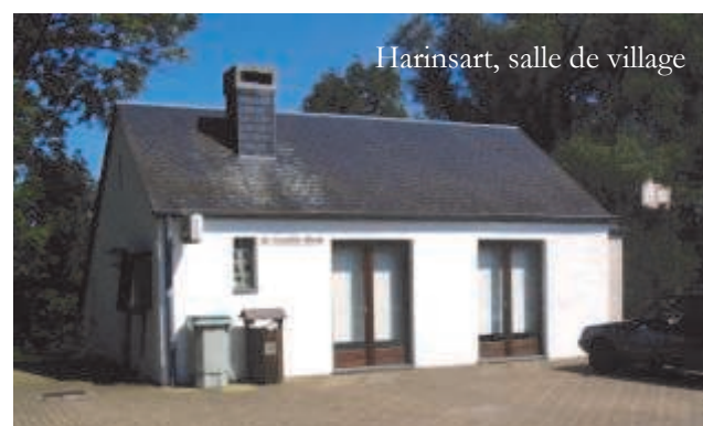
Harinsart, salle de village