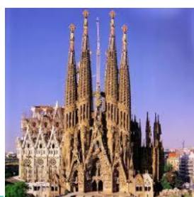
La Sagrada Família