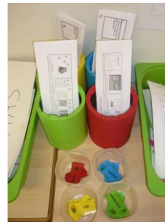
Boites à brevets