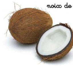
noix de coco