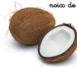
noix de coco