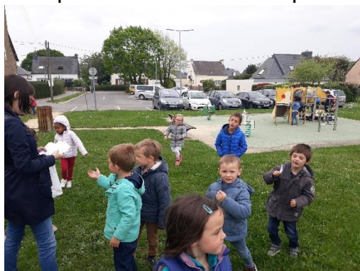
La chasse à l'œuf

Durant cette période, nous avons travaillé sur l'eau, et plus particulièrement sur le thème de la mer, le tout rythmé par de nombreux temps forts.