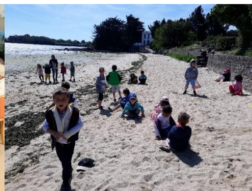
Sortie scolaire à l'Île aux Moines