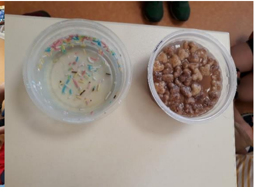
Verser, mélanger, observer : sciences autour de la dissolution.