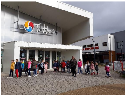
Sortie Cinécole : « D'un conte à l'autre ».