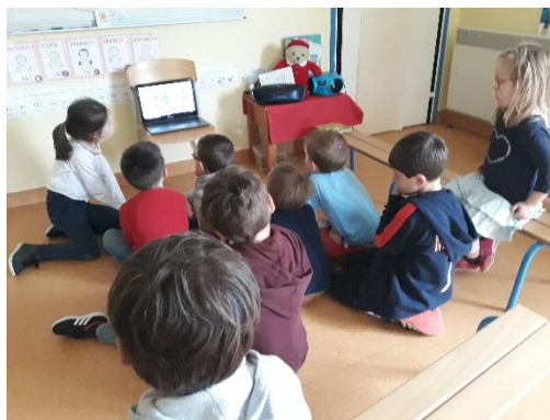
KT : l'Ascension et la Pentecôte