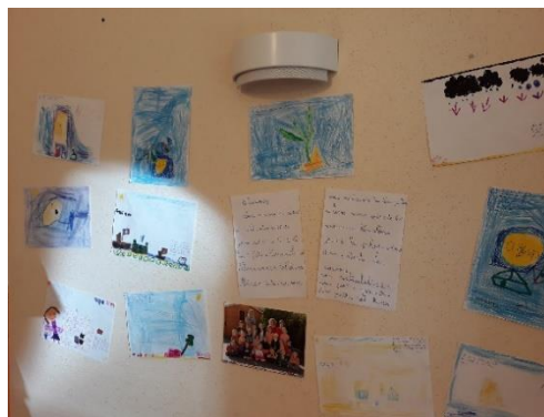
Ecriture et travail autour du courrier