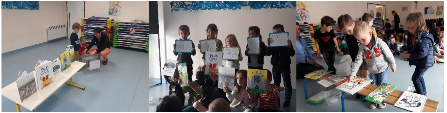
Le vote pour les Incorruptibles