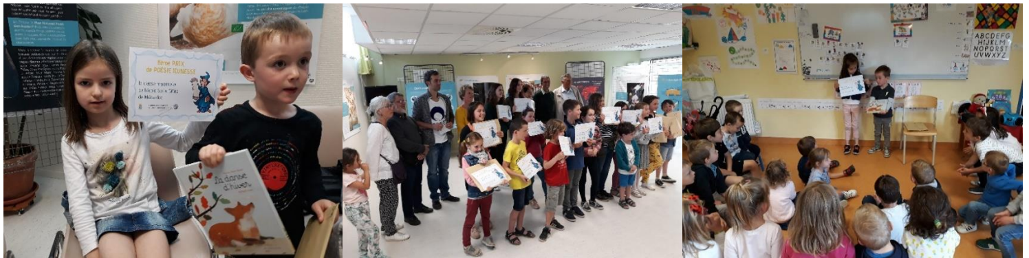
Remise des prix du concours de poésie.