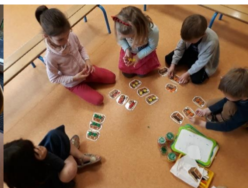
Recherches mathématiques : les partages, la monnaie, les compléments à 10, recherches