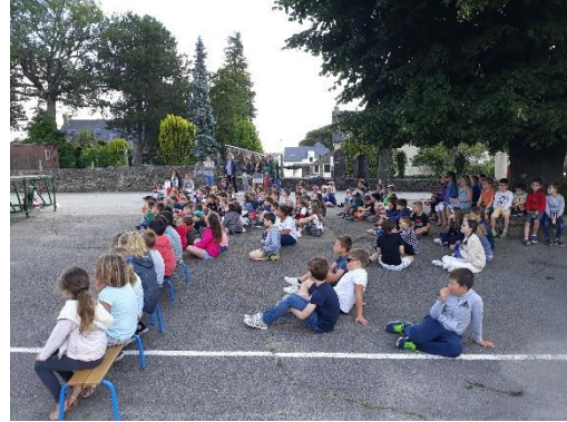
Préparation du spectacle pour la kermesse.