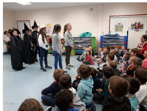
Découverte du spectacle de théâtre des classes de Virginie et Régine.