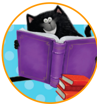
lecture à soi