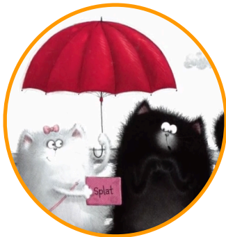
lecture à deux