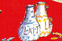
2. deux pots à lait