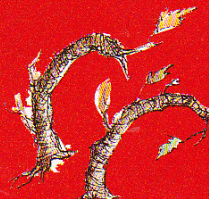
3. des ceps de vigne