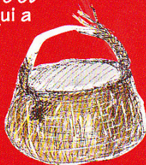
4. un vieux panier en osier