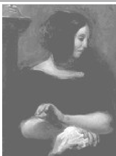
George Sand, Eugène Delacroix