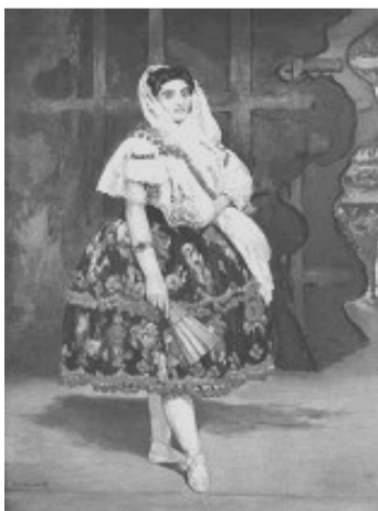
Lola de Valence, Edgar Manet