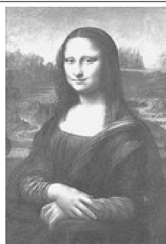
La Joconde, Léonard de Vinci