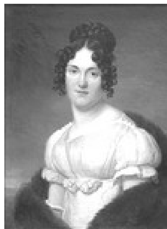
Portrait de femme, Henri-François Riesener