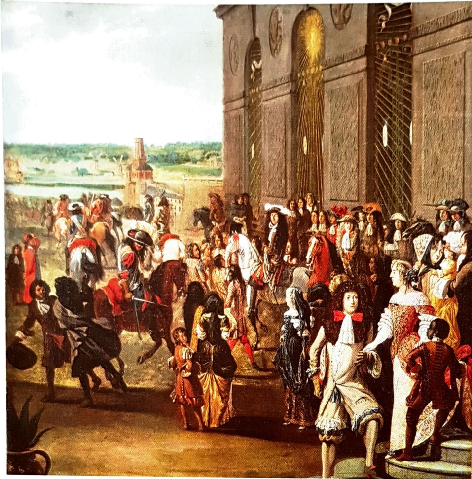
Peinture du XVII e siècle.