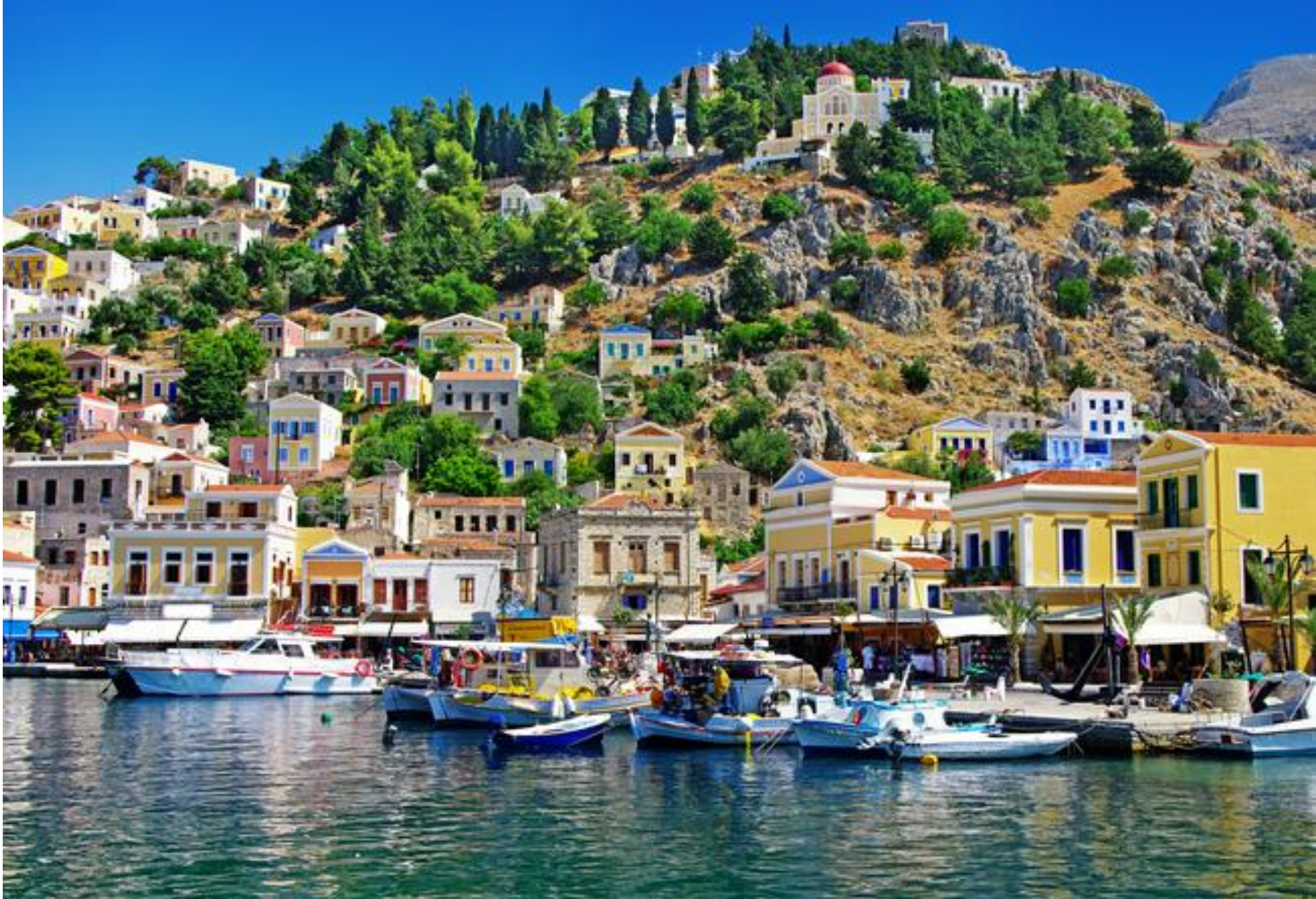
Paysage rural (de campagne) avec les maisons colorées d'un village.