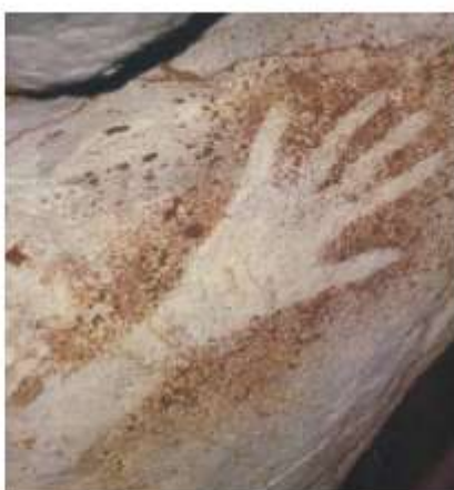
Main peinte, vieille de 27 000 ans, Grotte Cosquer (Marseille)