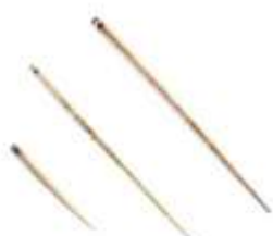
Des aiguilles à chas (trou) en os (vers 14 000 avant J.-C.).