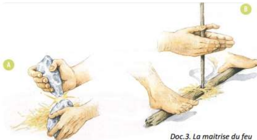
Doc.3. La maîtrise du feu [Magellan - Hatier]