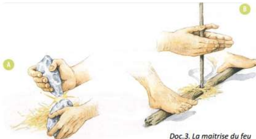
Doc.3. La maîtrise du feu [Magellan - Hatier]