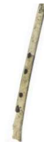
Flûte en os, vieille de 20 000 à 30 000 ans, Isturitz (Pyrénées-Atlantiques)