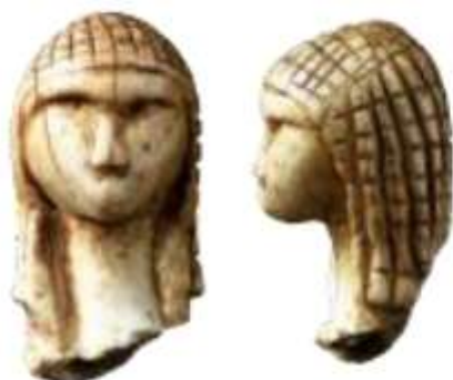
Vénus de Brassempouy, en ivoire, vieille de 23 000 ans (Landes)