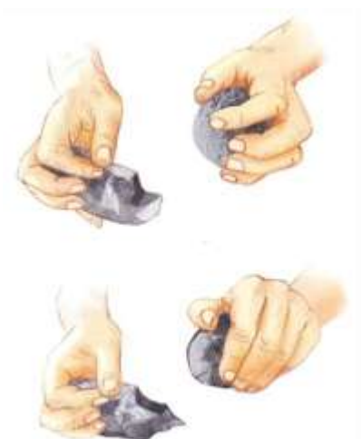
Doc.2. Technique de taille d'un silex [Ateliers Hachette]