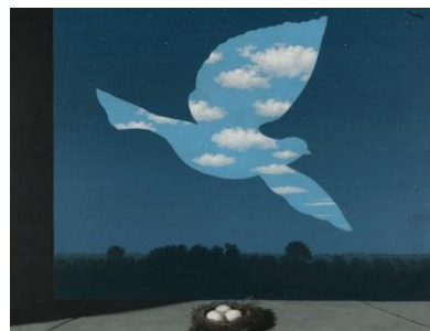
« Le retour », 1940.