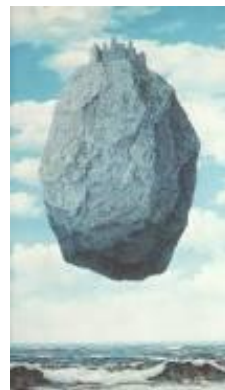
Le château des Pyrénées