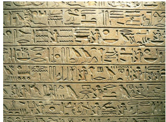
Ecriture hiéroglyphique égyptienne