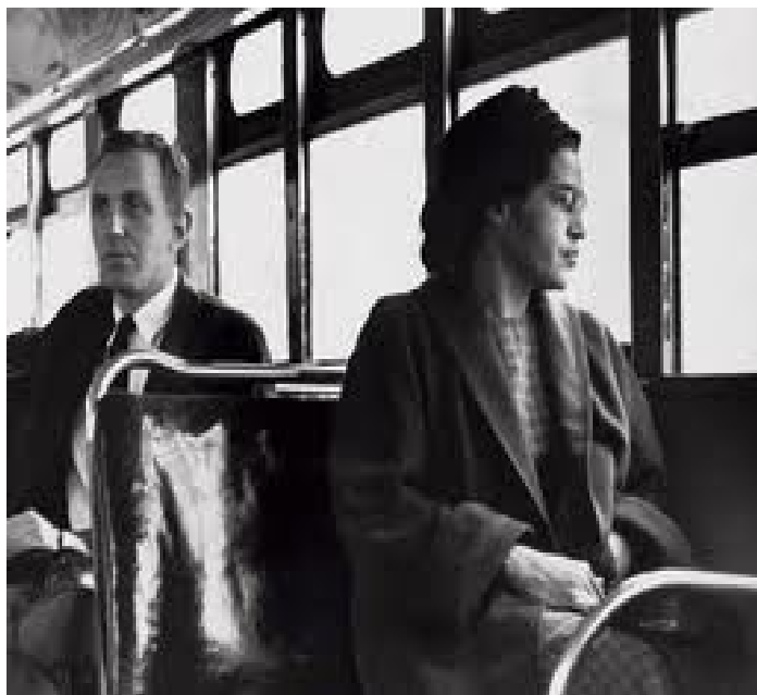
Rosa Parks refusant de quitter sa place de bus.

Dans un bus de Montgomery (Alabama), Rosa Parks, une femme noire de 42 ans, refuse de céder sa place à un blanc comme c'est la règle. Rosa Parks est alors arrêtée par la police et condamnée à payer une amende de 15 dollars. Une campagne de boycott contre la compagnie de bus est lancée, avec à sa tête un jeune pasteur noir, Marin Luther King . Le 13 Novembre 1956, la Cour suprême déclarera les lois ségrégationnistes de Montgomery illégales.