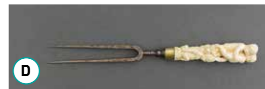
D Fourchette en fer et en ivoire de 1595

4 En t'aidant de l'âge de ces vestiges, remets dans l'ordre chronologique l'invention des couverts.