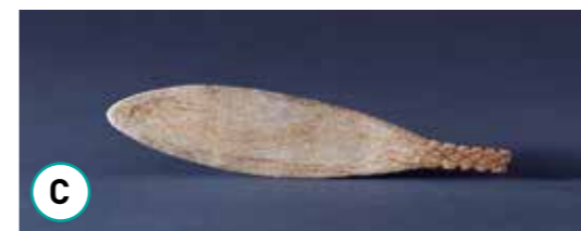
C Cuillère en os de 15000 av. J.-C.