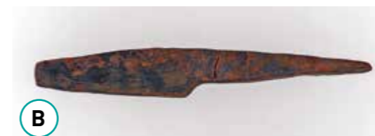
B Couteau en fer du 5 e siècle