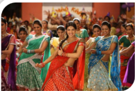
Scène de danse

Bombay est la ville la plus peuplée de l'Inde. C'est dans cette ville que sont tournés les films.