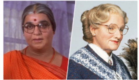
Madame Doubtfire est devenue Anjali Shanmughi.

La danse Bollywood est une danse rapide qui demande énormément de coordination dans les mouvements. Les danseurs principaux sont toujours accompagnés d'une troupe de danseurs.