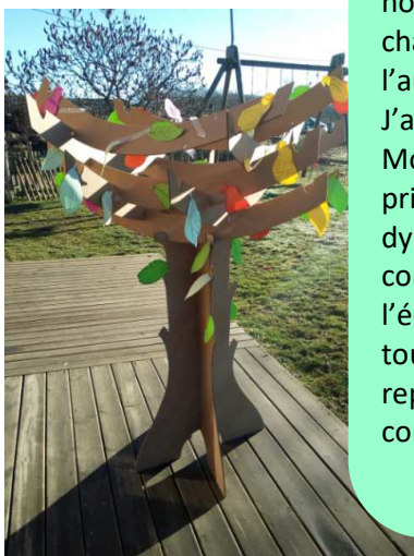
Arbre des révolutions inventées, imaginées par ceux qui sont passés le matin à notre atelier

Environ 800 personnes sont restées pour la célébration finale, à tel point que 400 personnes qui n'ont pu trouver de places dans la chapelle des Chartreux, y ont assisté dans la grande salle des conférences. Malgré des problèmes techniques de retransmission, cette eucharistie bis , a été une réussite de simplicité, de chants joyeux... Merci au prêtre qui spontanément nous a aidé à entrer dans cette célébration. Marité