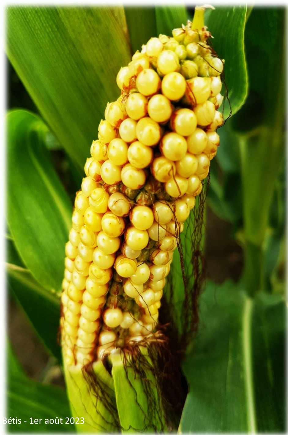
Montage d'Émerance Bétis - 1er août 2023