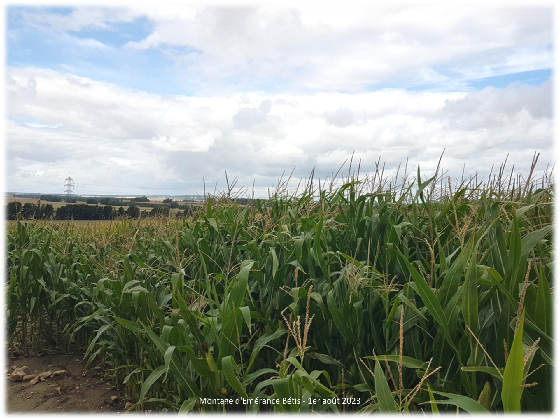
Montage d'Émérance Bétis - 1er août 2023