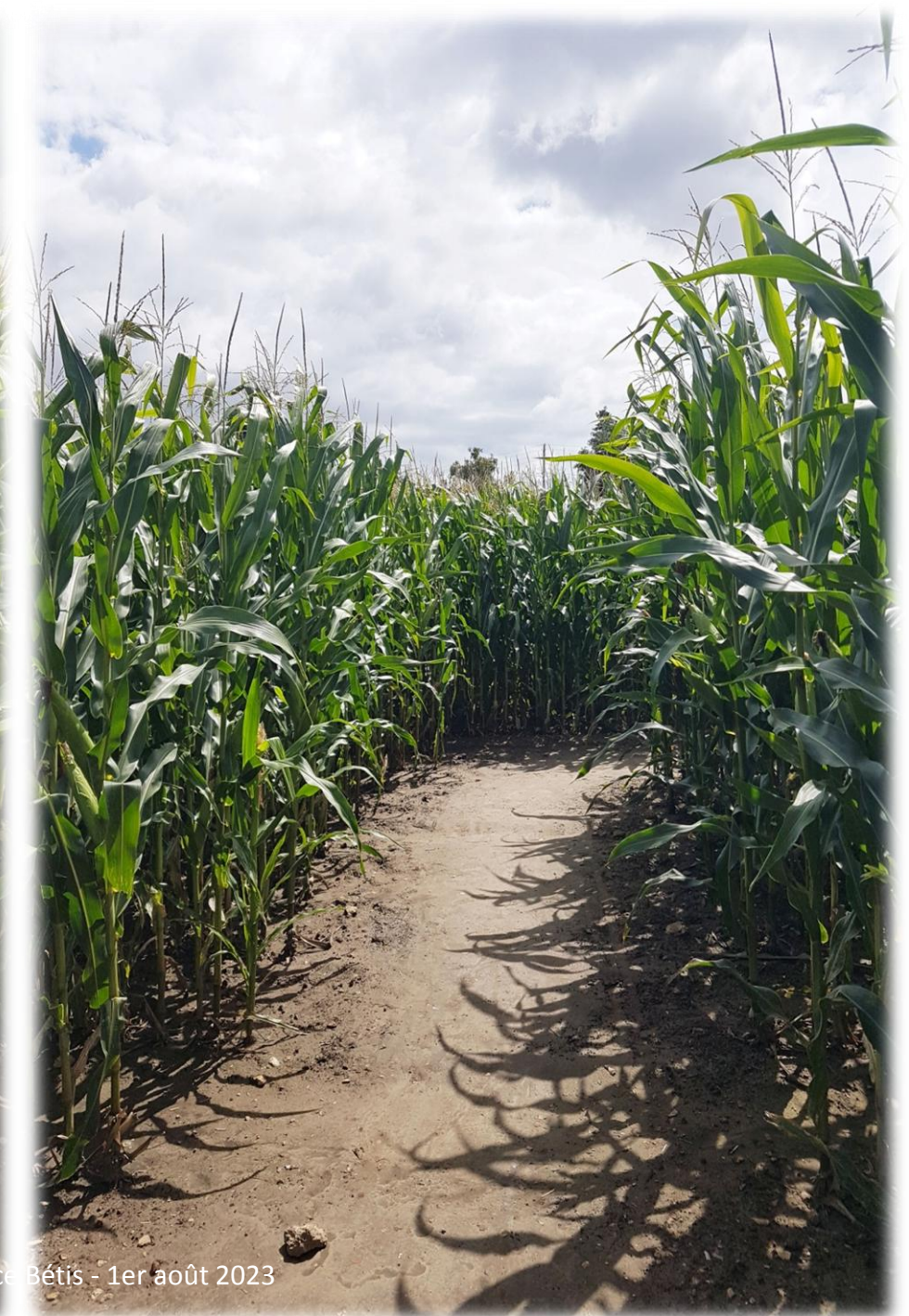
1er août 2023