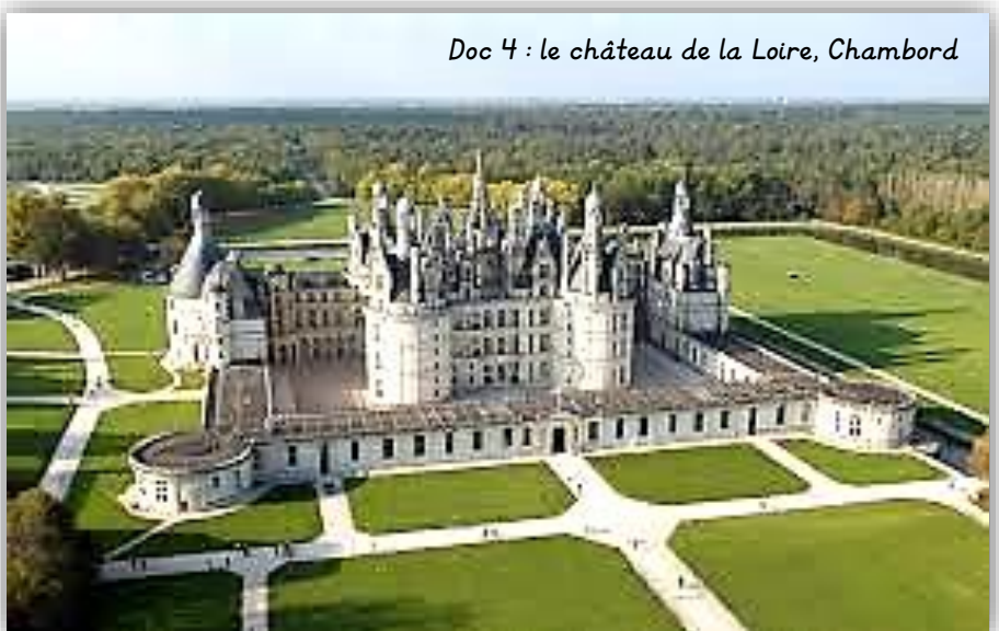
Doc 4 : le château de la Loire, Chambord

Le château de Chambord, construit sous François I er , comprend 440 chambres et 365 cheminées. Le parc comprend aujourd'hui 5 500 hectares de bois fermés par un mur de 32 kilomètres de long.