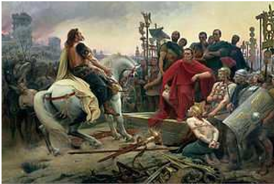
Vercingétorix dépose les armes aux pieds de Jules César à l'issue du siège d'Alésia

Ils ont remporté une victoire à ..... , mais ont été vaincus à ..... en ..... par les troupes de Jules César qui ont organisé le ..... de l'oppidum.