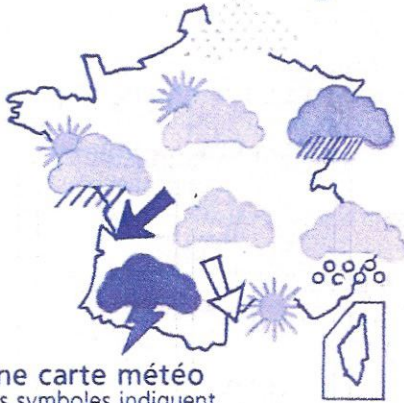
Une carte météo Les symboles indiquent le temps prévu par région.