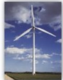
Panneaux solaires, éolienne