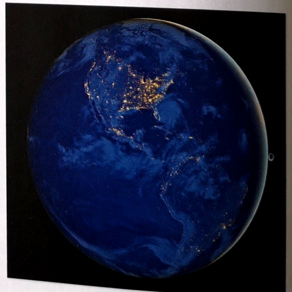
b. La Terre à 2 h du matin aux États-Unis.