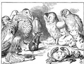
La leçon d'histoire de la souris.