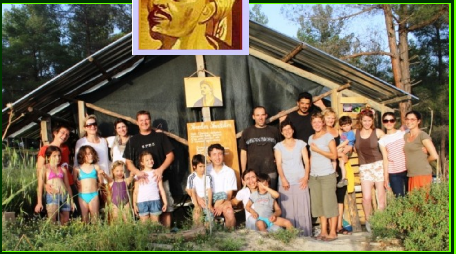
Photo de la journée « PHOENIX » en mai 2013 avec les amis d'Antalya:o))